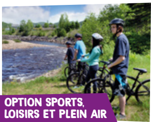
OPTION SPORTS, LOISIRS ET PLEIN AIR