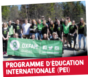
PROGRAMME D'ÉDUCATION INTERNATIONALE (PEI)