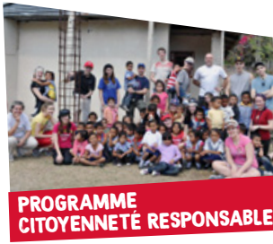
PROGRAMME CITOYENNETÉ RESPONSABLE